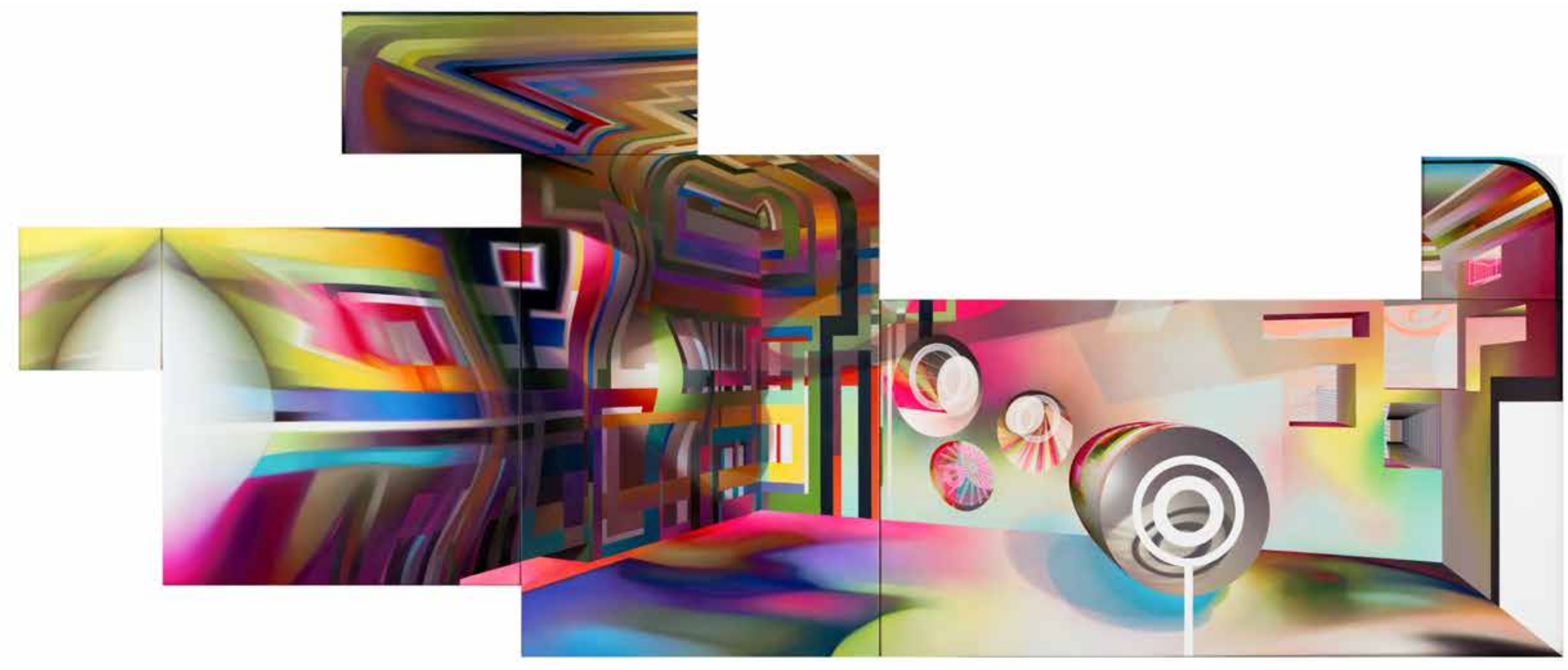
Alternating sequence #1 Alternating sequence #2 (andere kant/opposite side)